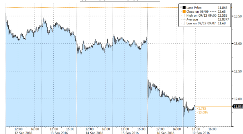
COTIZACIÓN DE DEUTSCHE BANK

En cuanto al sector energético, siguió cayendo por la corrección en el precio del petróleo derivado de la vuelta a la producción de Libia y Nigeria.